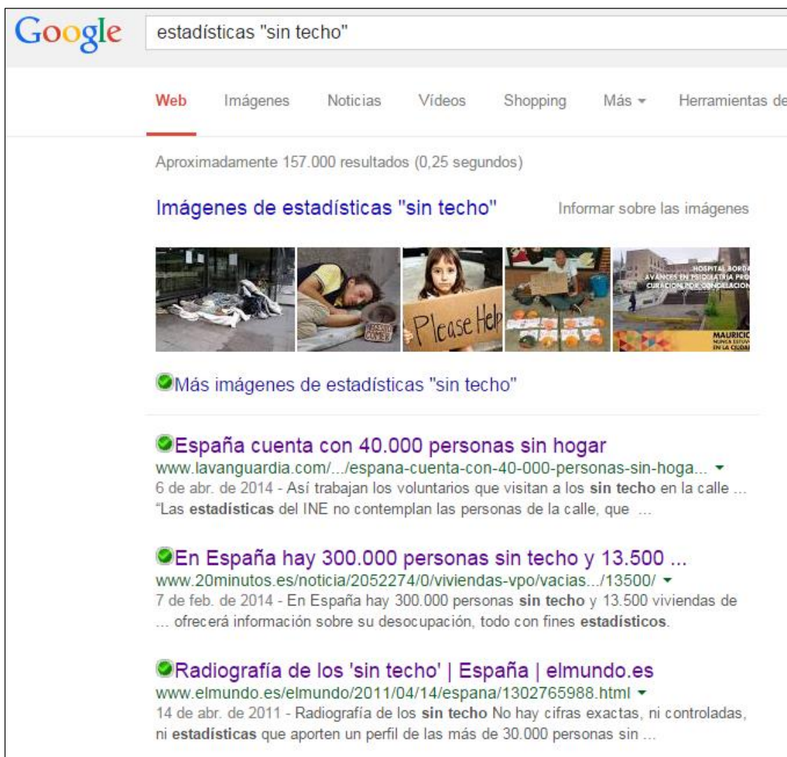
Resultados de búsqueda en Google

España hay 300.000 personas sin techo. ¿Es lo mismo no tener techo que no tener hogar? Si no es lo mismo parece que debería haber más sin hogar que sin techo, y no al revés. ¿Qué significa “sin techo”? ¿Qué duermen siempre en la calle? ¿Qué van a un alberge? ¿Que se ven obligados a vivir con un familiar aunque desearían independizarse? Una vez más, no saber a qué nos referimos quita valor a los datos.